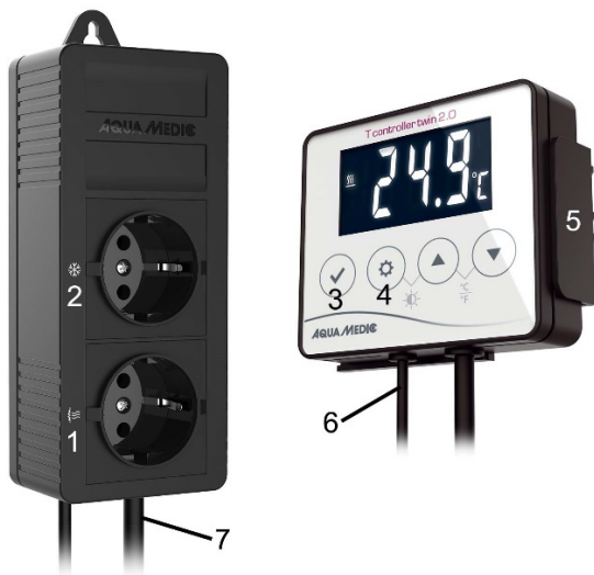
Fig. 1: T controller twin 2.0